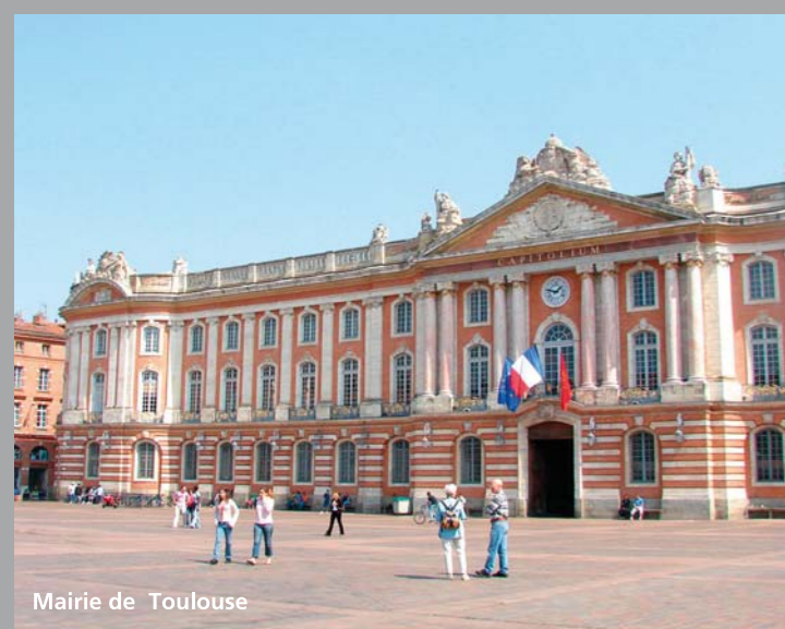
Mairie de Toulouse

Le centre ville à taille humaine, et l'activité culturelle et sportive foisonnante de la «ville rose» permettent de vivre dans une parfaite harmonie entre traditions et modernité.