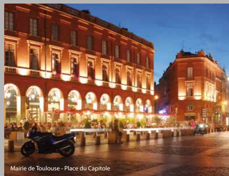
Mairie de Toulouse - Place du Capitole

Toulouse est aussi la ville de la jeunesse et des sports, avec ses multiples universités et campus et ses nombreuses performances sportives, dans le foot, le handball et bien sur dans le rugby avec le mythique Stade Toulousain.