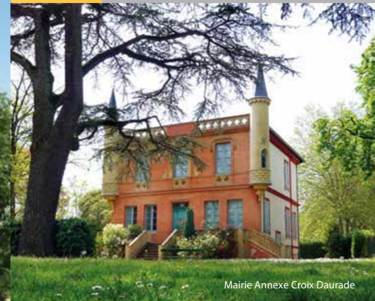
Mairie Annexe Croix Daurade