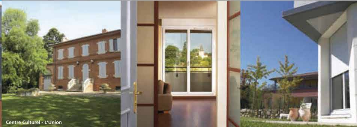
Centre Culturel - L'Union