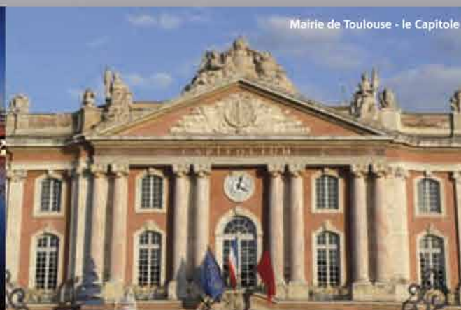
Mairie de Toulouse - le Capitole