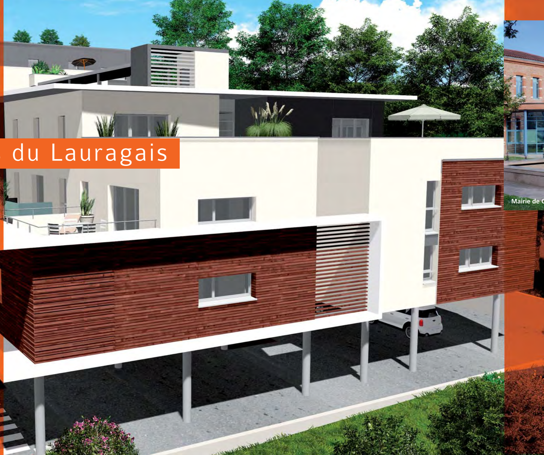
Mairie de Castanet-Tolosan