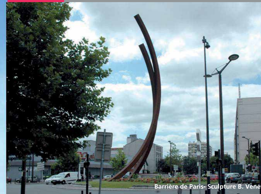
Barrière de Paris- Sculpture B. Venet