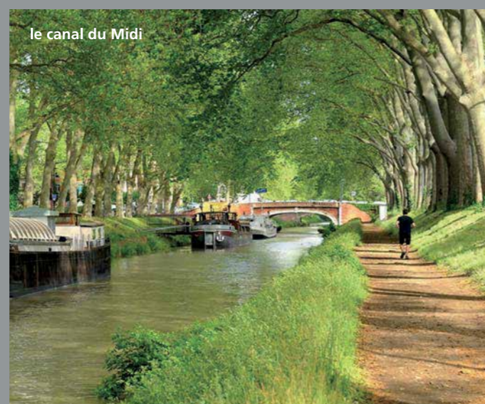
le canal du Midi

La richesse architecturale, le centre ville à taille humaine, et l'activité culturelle et sportive foisonnante de Toulouse permettent de vivre dans une parfaite combinaison entre traditions et modernité.