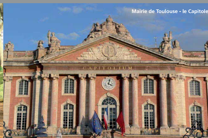
Mairie de Toulouse - le Capitole