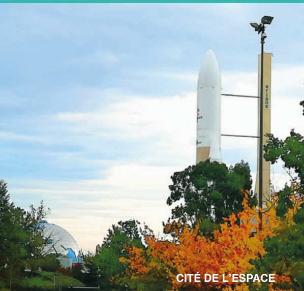
CITÉ DE L'ESPACE