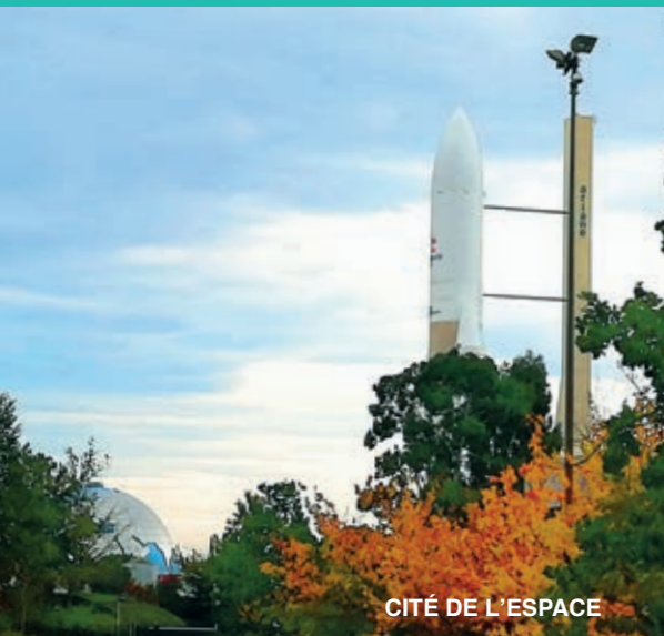
CITÉ DE L'ESPACE